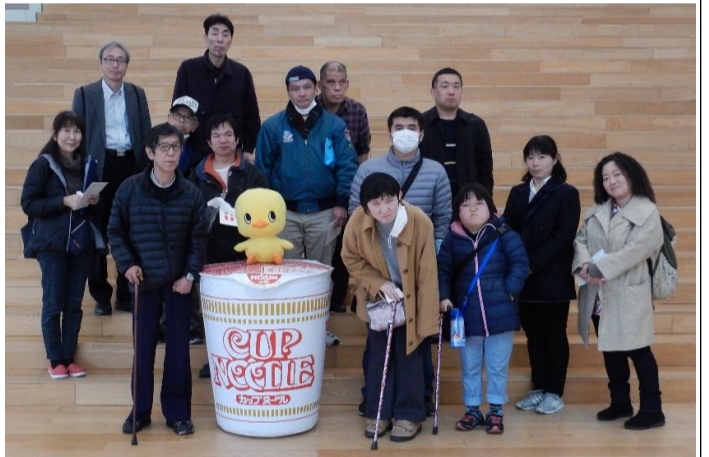
こんな大きいカップヌードルが欲しい〜!! それぞれ個性的なラーメンができて 美味しくいただきました!!

1月中旬にスマイルでは外出訓練で横浜に出かけました。まずはカップヌードルミュージアムに行き、カップヌードルの容器に模様や絵を描き、味や臭も自分の好みに選んでオリジナルのカップヌードルを作りました。持ち帰り用の袋に入れて膨らませるのも自身で行い、それぞれ大満足のお土産が出来上がりました。次に、中華街へ行きたくさんの種類の料理を仲間と話をしながら味わいました。「麻婆豆腐だ!」「エビチリだね!」など、おなじみの料理を笑顔で頬張り、ほとんどの人がデザートは杏仁豆腐まですべて完食していました。最後にマリントワーを見学しました。景色を楽しむ人、高所のために緊張していた人などさまざまでしたが360度遠くまで景色を堪能しました。直前に降って凍った雪が残っている中、バスの乗降や高速道路状況が心配されましたが、みんなの熱いエネルギーで無事に楽しい一日を過ごす事ができました。