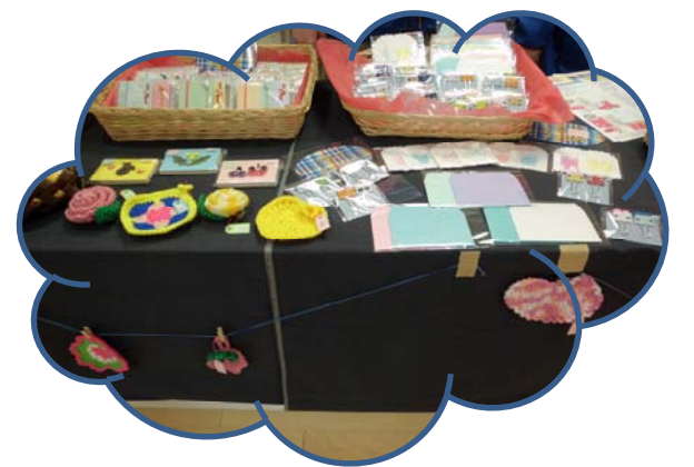
いろいろな商品を販売しました!!

当日、販売担当した利用者も笑顔で接客して、お客様と交流したり商品の説明をしたりと大忙しでした。