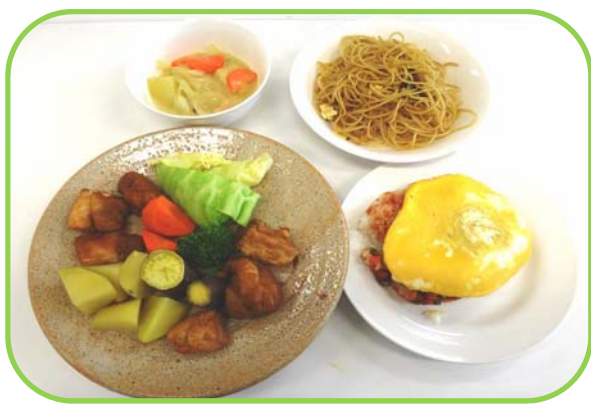
とても簡単でした!

これからも、安く簡単な栄養のある料理をみんなと一緒に考えながら作っていきたいです。