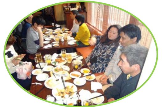
沢山食べてたくさんお話しして交流しました!!